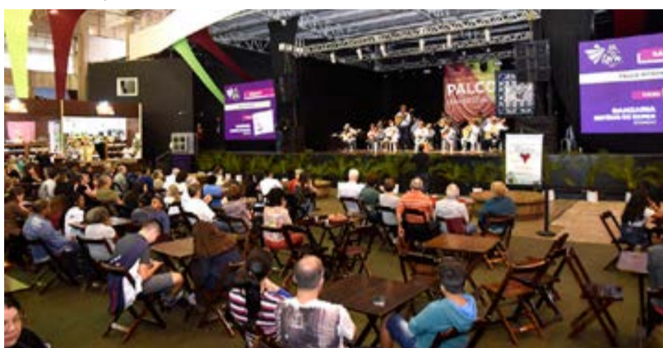
Festa da Uva