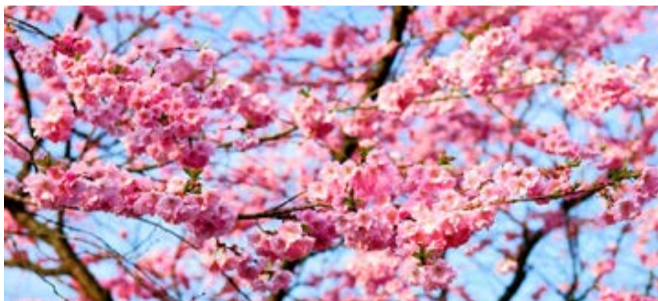
Festa da Cerejeira

Saindo das festas juninas, incluímos até a capital paulista. São Paulo oferece o clás-