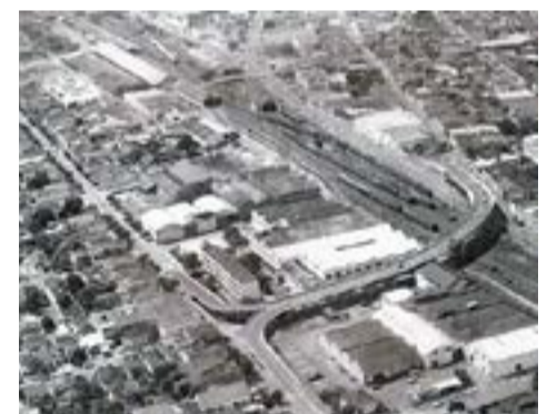
Viaduto da José Bonifácio

Implodido há mais de 20 anos, nesta foto aérea é possível ver toda a extensão do viaduto e também as composições férreas que ainda transportavam pessoas e cargas de Panorama até São Paulo.