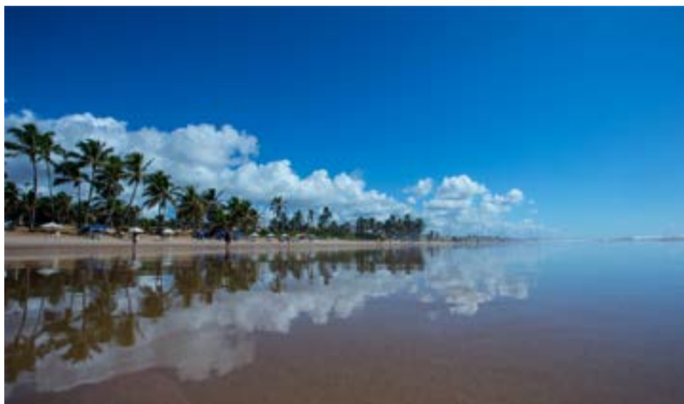
Praia do Flamengo, em Salvador (BA).

Uma pesquisa de abril da Associação Brasileira de Agências de Viagens (ABAV) reforça o otimismo do setor. Conforme o levantamento, o ramo que fechou 2021 com um faturamento 37% superior ao de 2020 (R$ 19,2 bilhões), os deslocamentos domésticos seguem liderando a retomada do turismo. O estudo mostra que, no primeiro trimestre deste ano, os destinos mais pro-