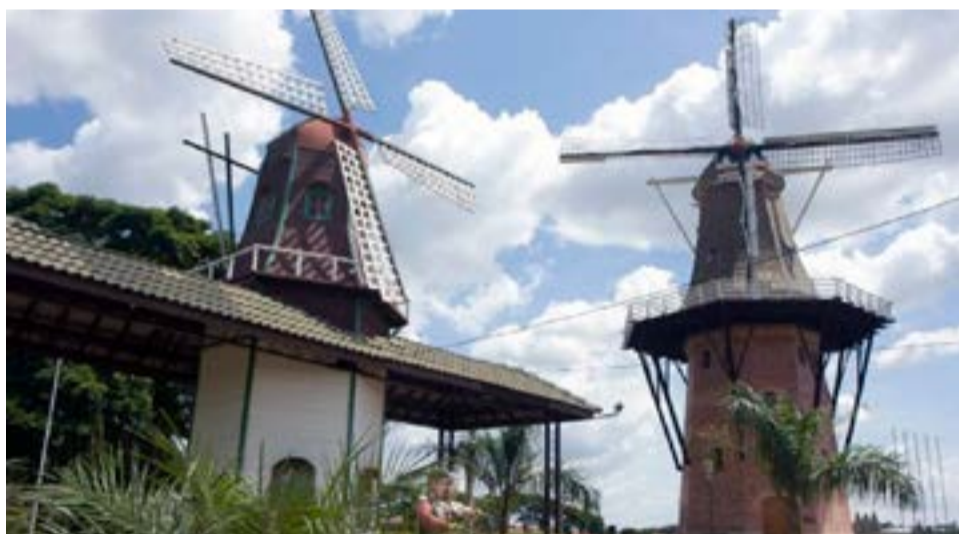
Holambra e suas festas

sico festival italiano no Brás, a Festa de San Mártir, que acontece aos sábados de junho e julho. E também a Festa do Imigrante, realizada nos primeiros finais de semana de junho no bairro da Mooca com ingressos a preços populares.