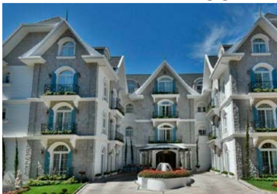
Colline de France, hotel 5 estrelas