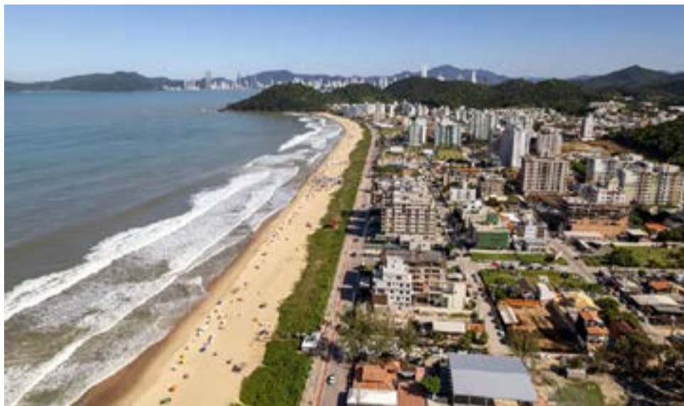
A cidade de Itajaí, localizada no litoral norte de Santa Catarina.

A expectativa é que o turismo venha a se tornar uma matriz econômica cada vez mais forte para a cidade.